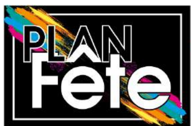
Savoir-Fête en province de Luxembourg

En octobre et novembre 2019, s'est déroulée la formation « De la réduction des risques à la prévention des assuétudes » mise en place pour la première fois dans le cadre du Plan Fête.