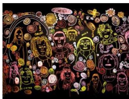
Je suis BelleS, un projet et une exposition de femmes fréquentant les institutions sociales partenaires d'Article 27 Nord Luxembourg (CPAS, Centre croix-rouge, Maison médicale, PCS, Santé mentale,...)