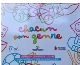
Un jeu coopératif qui permet de réfléchir de manière ludique à nos modes de fonctionnement et d'ouvrir le débat sur les questions d'égalité entre les sexes et les genres.