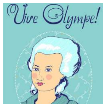
Kit pédagogique de Cultures&Santé asbl