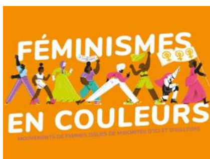
Kit pédagogique de Cultures&Santé asbl