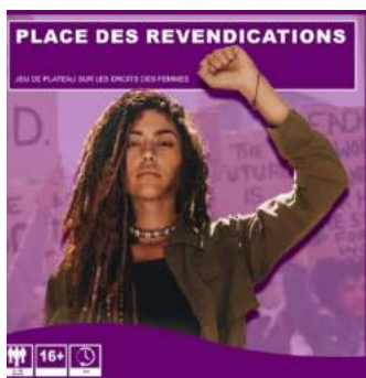
Jeu de plateau du CAL/Luxembourg asbl